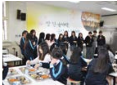
선학중 점심 수요일음악회 중 학생회 활동