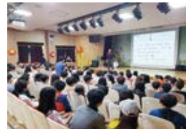
서흥초 6학년 다모임