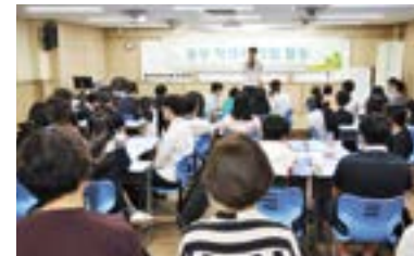
동부지역 중학교 학생회연합 활동(동학)