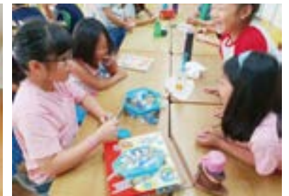
부평서초 1학년 100일 학급 잔치