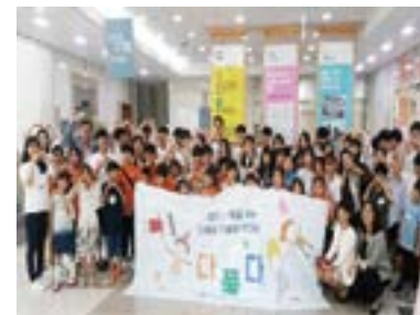
다문화 축제를 진행한 북부지역 논스톱 활동

자신이 속한 사회(공동체)에 관심을 가지고 실천하여 공동체의 발전에 기여하는 행동을 사회참여라고 합니다. 학생자치활동은 이런 사회참여를 통해, 나와 이웃의 삶을 더욱 행복하고 안전하게 만들어 줍니다.