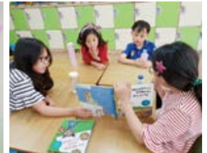
선배가 읽어주는 동화