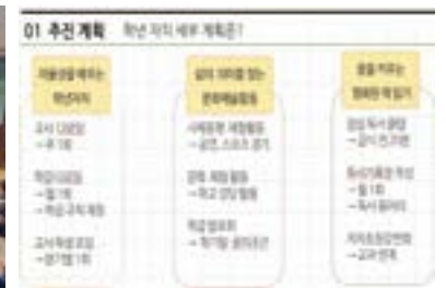
부개교 1학년 스스로 학년 운영