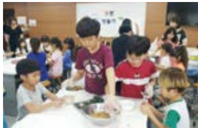
도립초 대의원회 추석맞이 행사