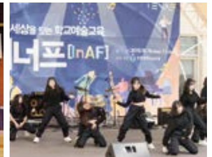
인천학교예술교육 페스티벌 동아리 발표