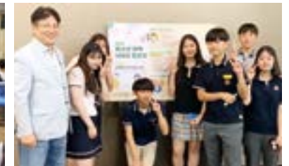
교육감에게 청소년 정책을 제안