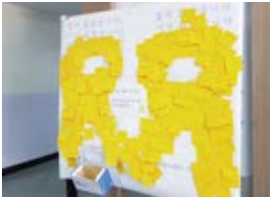
부원중 학생회 세월호 추모 행사