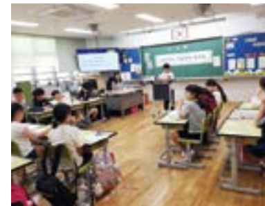
'ㄷ'자로 하는 학급회의