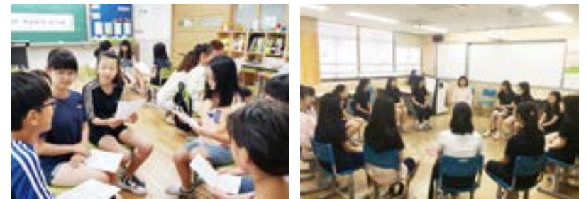
‘ㅇ’자로 하는 학급회의