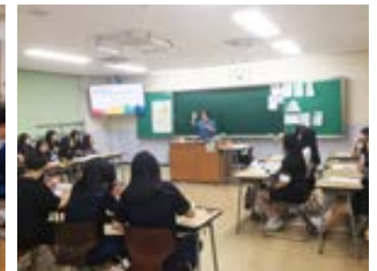
'ㄷ'자로 하는 찬반토론