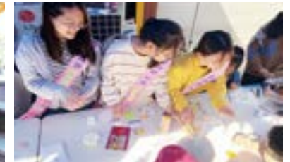
산곡여중 '우리말 사랑동아리' 마을활동