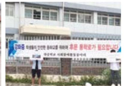
통학로 설치 위한 강화중 학생사회참여 활동