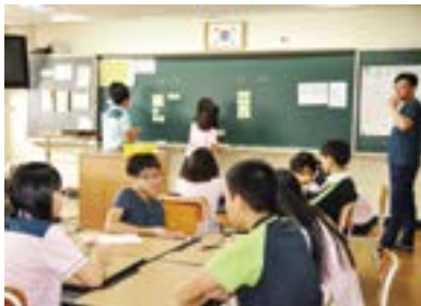
‘ㄹ’자로 하는 학급규칙 정하기