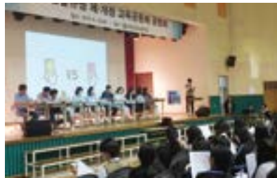
신현고 학생생활규정 제개정 대토론회