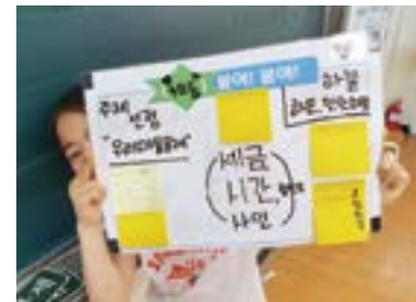
만수초 마을로 운영하는 스스로 학급 운영