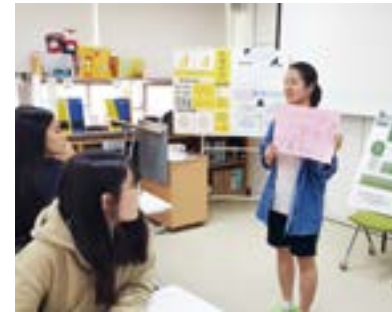
사회참여를 위한 프로젝트 수업