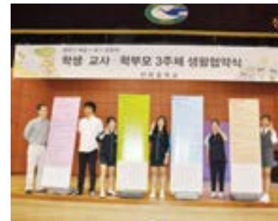
함께 만드는 교육 3주체 생활협약