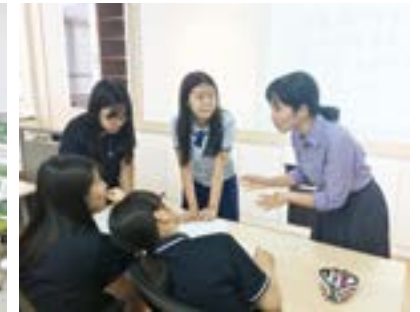
학생 주도의 공간혁신 프로젝트 수업