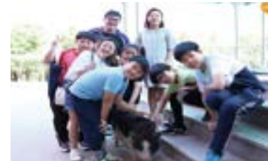
서흥초 돼지돌봄 동아리 '똥아리' 활동