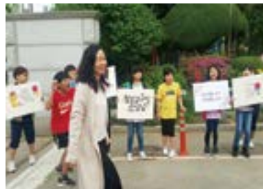
도림초 대의원회 스승의 날 축하 등교맞이