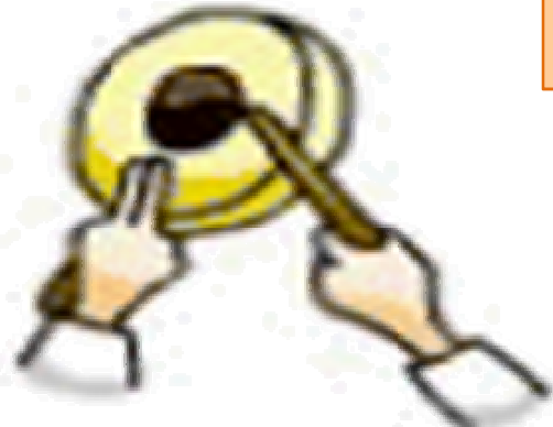
소고를 꼬아 채로 북치기