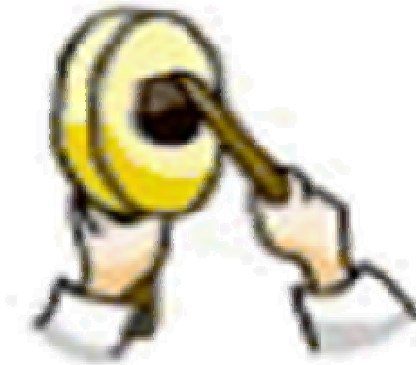
소고채로 북 치기