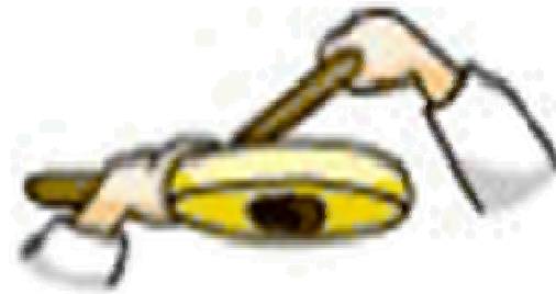
소고채 끝으로 북 치기