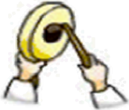
소고채 끝으로 북 치기