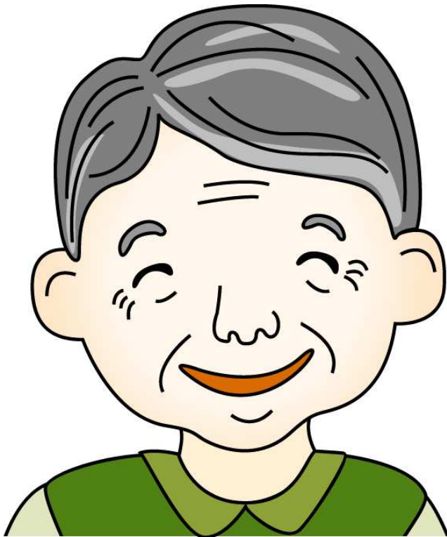
입할아버지 - 엄마의 아버지