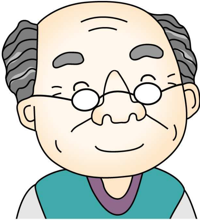
할아버지 - 아빰의 아버지