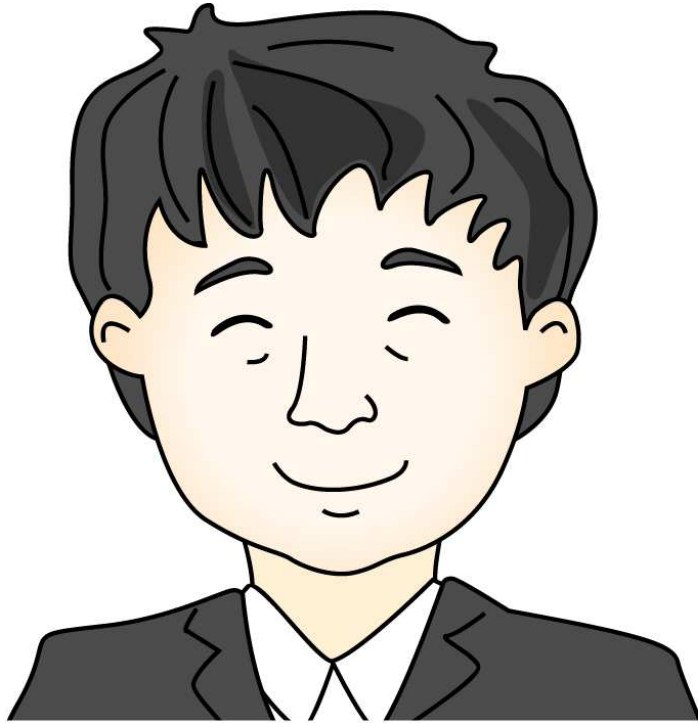
큰아버지 - 아빠의 형님 작은아버지 - 아빠의 동생