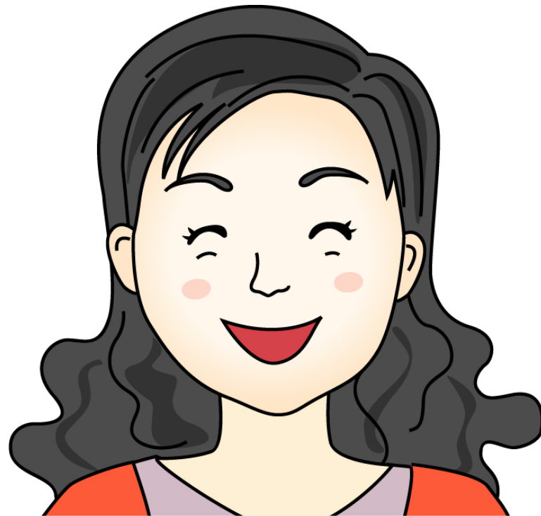
이모 - 엄마의 언니 엄마의 여동생