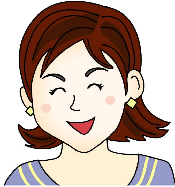
고모 - 아빠의 누나 아빠의 여동생