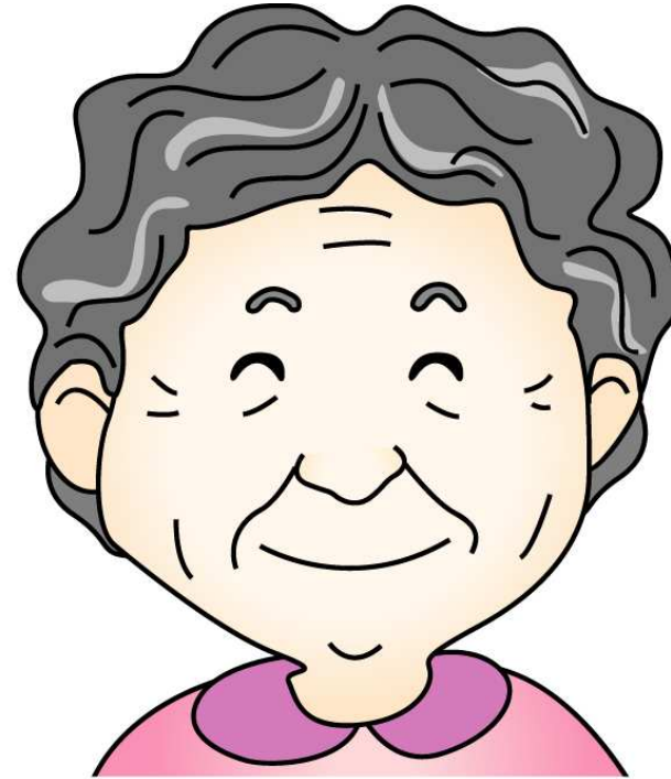
할머니 - 아빰의 어머니