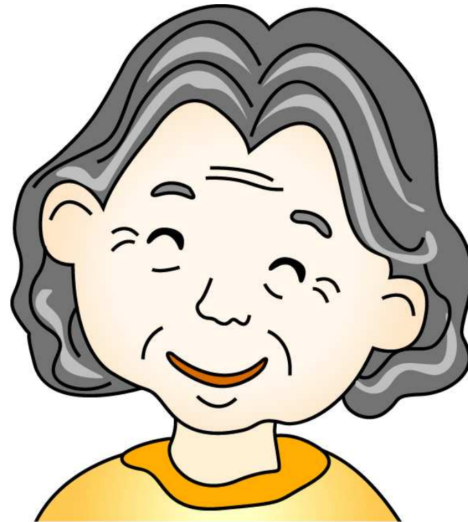
입할머니 - 엄마의 어머니