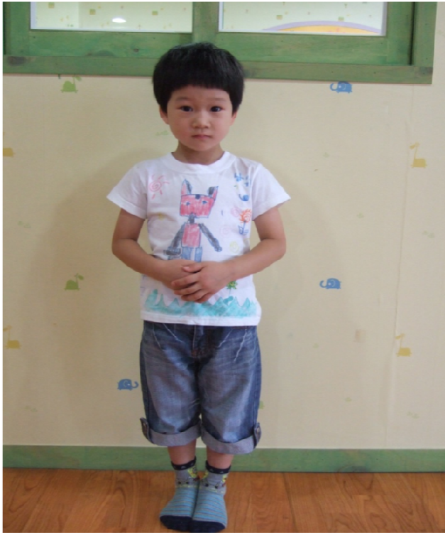
옷을 바르게 입어요