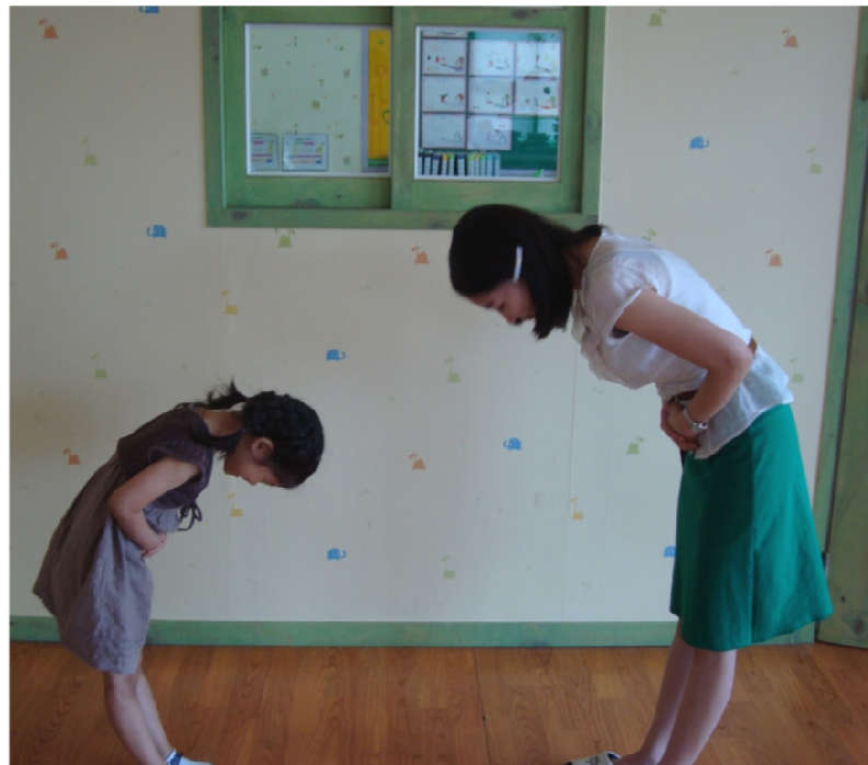
예절 바르게 인사해요