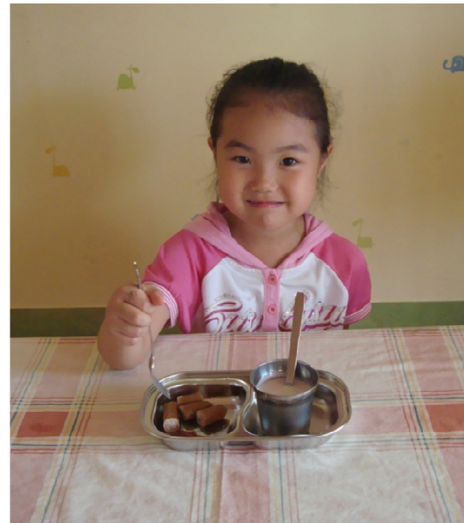
예절 바르게 식사해요