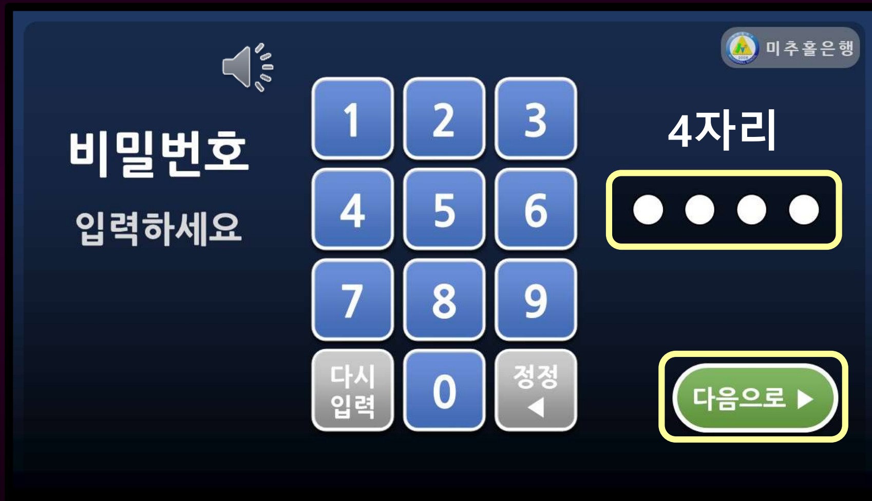
카드 비밀번호 입력