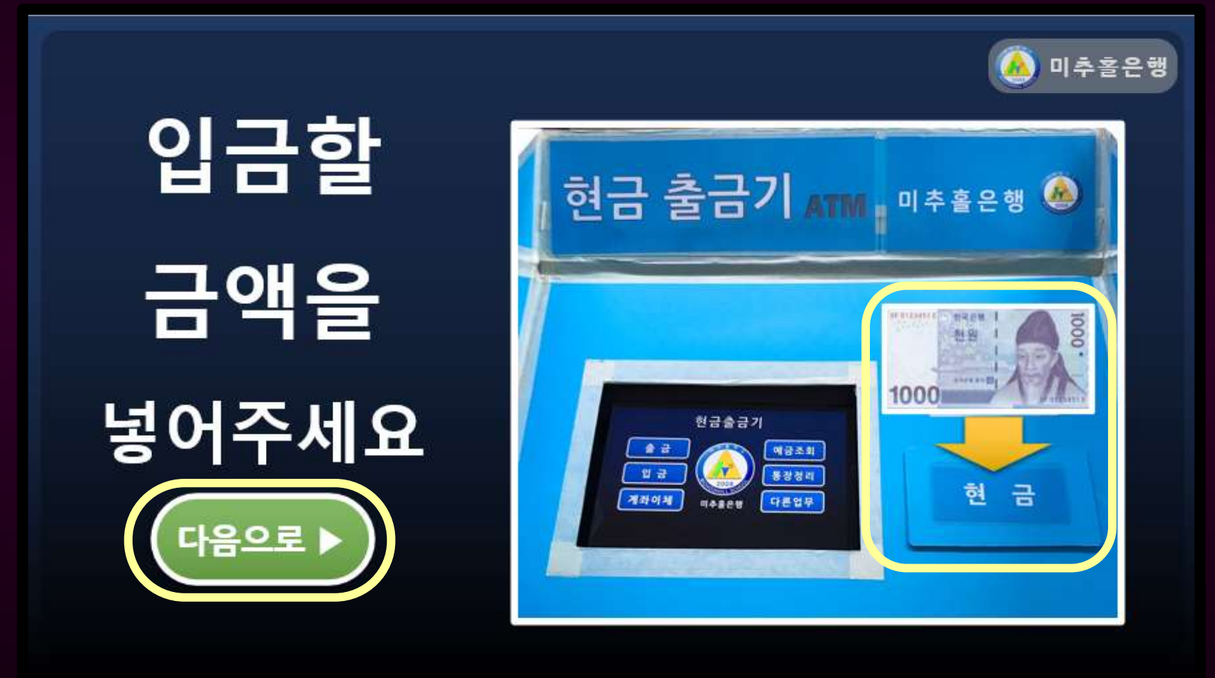
입금할 금액 넣기