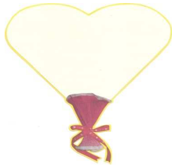
부케 손잡이 팀이름 카드